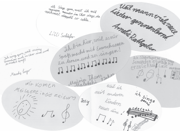
Äußerungen von Kindern des Chores der Grundschule Herresen Sulzbach

Um diesen Entwicklungsprozess erfolgreich gestalten zu können, bedarf es der motivierten Beteiligung und Unterstützung der Mehrheit des Kollegiums, der Eltern und im Sinne einer ganztägigen Bildung natürlich auch der Erzieher. Die Qualität und die Wirksamkeit einer Musikalischen Grundschule sind im Wesentlichen davon abhängig, wie gut es gelingt, die jeweils vorhandenen musikalischen Ressourcen der einzelnen Beteiligten zu nutzen, weiter zu entwickeln und praktisch im Schulalltag anzuwenden- und zwar in dem Maß, wie es von allen Mitwirkenden für sinnvoll erachtet, gewollt und leistbar ist.